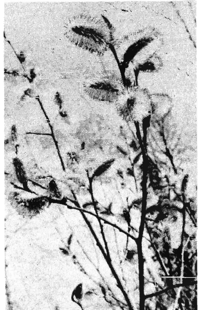
Вот и верба расцвела

Деву (24 августа — 23 сентября) покидают негативные тенденции промозглого марта. Вы вновь полны энтузиазма и оптимизма. Возникает желание рискнуть. Что ж, у вас большие шансы на успех. Астролог рекомендует самостоятельные действия, партнеры могут подвести. Вероятна длительная поездка на юг. Ваши лучшие дни — 11, 20 и 28 апреля. Во всех начинаниях преуспеют энергичные дамы. Поклонник готов вырвать сердце из груди и бросить его к вашим ногам. Желтый и бежевый — цвета успеха в апреле.