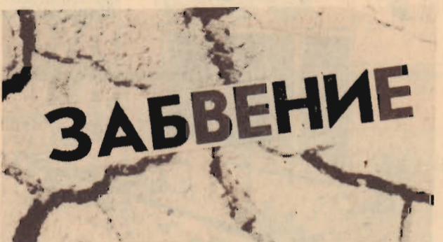
Эхо прошлых лет