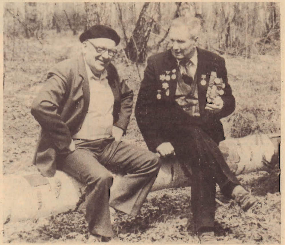
Вот и потеплело...

Может быть, это и не имеет прямого отношения к делу, но сад для пенсионеров Буевых слишком много значит — столько труда они в него вложили и так хорошо он благодарил их все последние годы. В 1978 году сад уже пережил бедствие — подработку шахтой имени Ярославского.