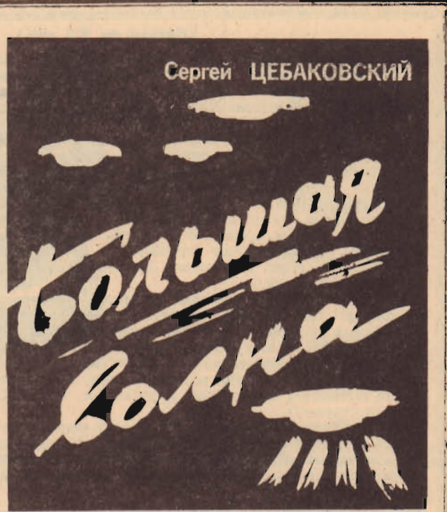
(Начало в № 67).

Итак, волна наблюдений 1952 года! Отдельные капли, ее составляющие, мало чем отличны от капель-донесений прежних месяцев и лет. Трудно выделить что-то новое, необычное. Все тот же небесный реквизит в виде ночных огней, дневных шаров и дисков, реке — цилиндров и ракет. Все те же неземные скорости, крутые виражи, внезапные остановки в воздухе, зависания, иногда с покачиванием, дрожанием, пошатыванием по горизонтальной оси плоскости при замедлении хода. И парением древесного листа — при снижении.