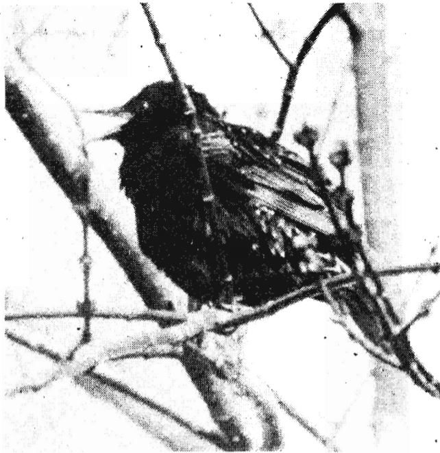
Природа и человек

Корм у него из растительной пищи — только коренья зонтичных, а питания ему нужно много. Он очень свирепый, и ему в это время лучше не попадаться. Идет косяком по лесу, ловит лесные запахи. Подошвы ног у него голые, но он не чувствует холода: кожа на ступнях толстая — непромокаемая, а под ней слой жира. Он то на одном дереве распахнет когтистой лапой, то на другом, а где и просто бок почешет. Это он охватывает на своих охотничьих угодьях метки. И не дай боже, если кто из его сородичей забредет на его угодья.