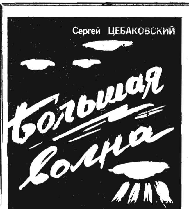
(Начало в № 67).