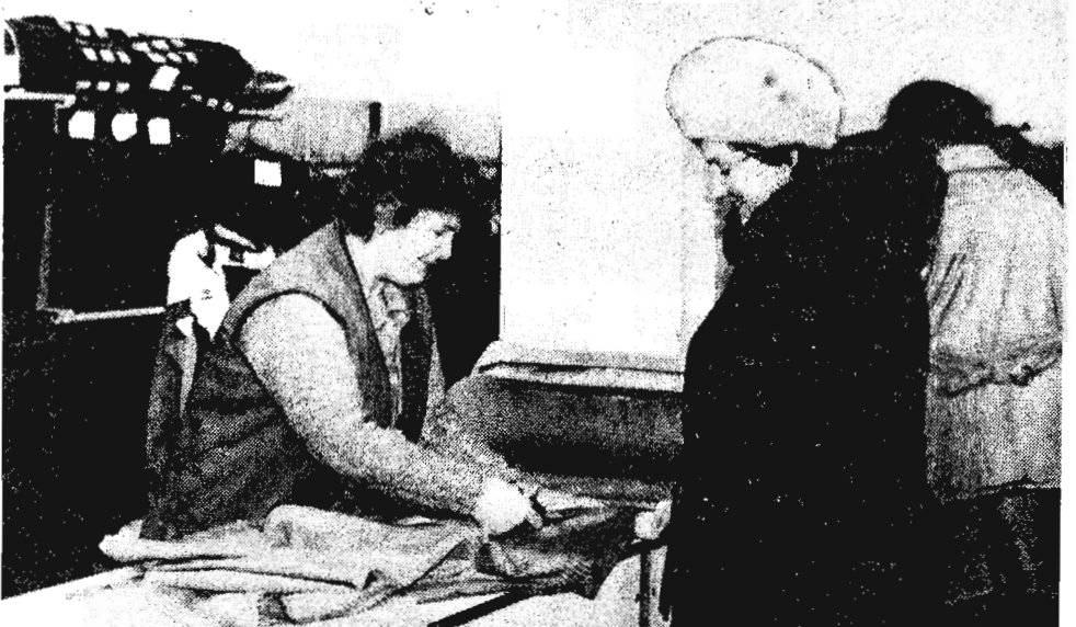
На снимках: покупатели выбирают и оценивают; покупка состоялась.