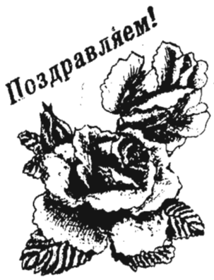
Дорогих наших родителей Валентию Гаври-

Смотрите на экране ЦДК с 10 по 16 мая «БАБОЧКА» — производство Франции. Фильм о невероятных приключениях очаровательной женщины, отправившейся на поиски своего отца-биолога, не вернувшегося из поездки за редкими, экзотическими бабочками. На долю героини выпадает посещение города, населенного женщинами-насекомыми, и побег с пиратского корабля, и многое другое. Сеансы: 18, 20. Индийский фильм «ЛЮБОВЬ — ЛЮБОВЬ — ЛЮБОВЬ». Сеанс 15 часов.