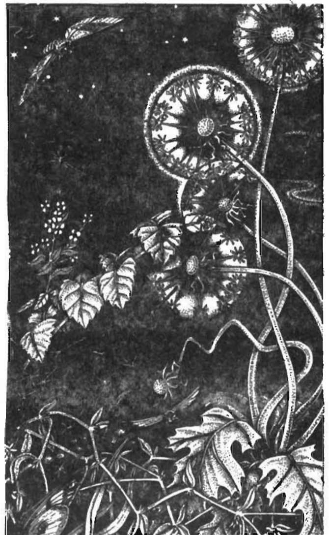
После этого сама ушла далеко на север. С тех пор одуванчики сначала но- сят желтые береты, а по- том - белые пушистые шапочки. Н. ИПАТОВА.

А зима-старуха пряталась в это время в глухом, дремучем лесу, в сыром, холодном овраге. Услышала она, что солнышко смеется, и тихонько выглянула из своего укрытия: «Чему это оно радуется?» Смотрит, в зеленой траве светятся миллионы маленьких солнышек. От них вся поляна кажется золотой. Ох и разозлилась зима! Махнула серебряным рукавом и вмиг запо- рошила снегом веселые золотые огоньки.