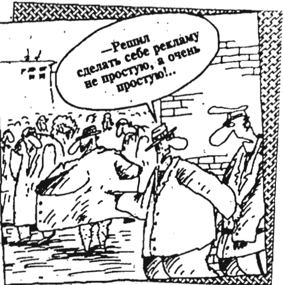
Рис. В. Шилова.