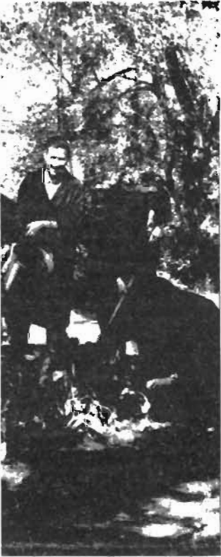
Всего в зеленстрое четыре такие бригады. Они заботятся о клумбах на проспекте Кирова, в Мартовском сквере, в микрорайоне, в центре города.

Георгины бригада высаживала на одной из клумб сквера на улице Ломоносова. На других клумбах расцветут циннии, астры, львиный зев. Раньше городская цветочная палитра была намного богаче. Но сейчас трудно стало приобретать семена. Что удается достать, тем и обходятся.