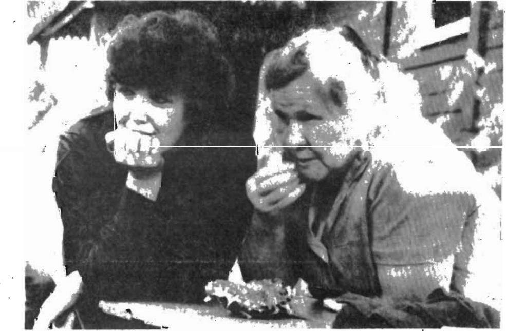
Поговорим о том о сем...