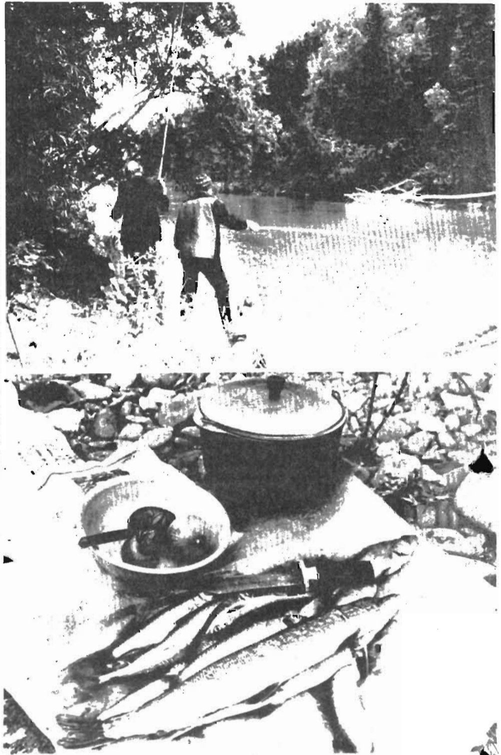
Уха будет отменной!