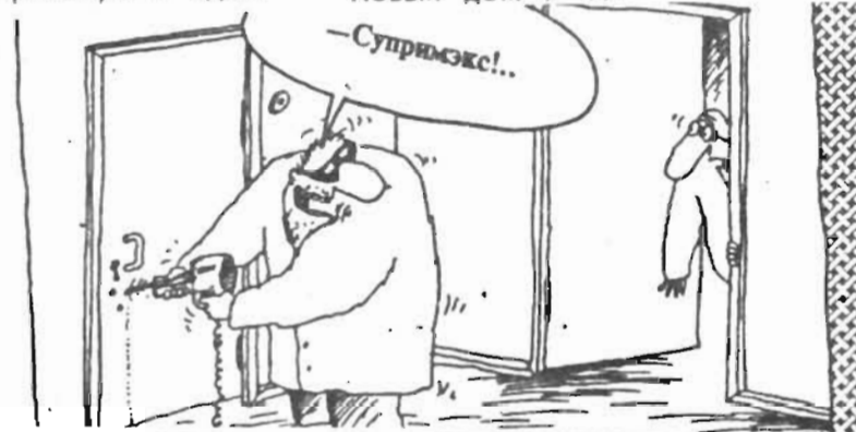
Рисунок В. Шипова.