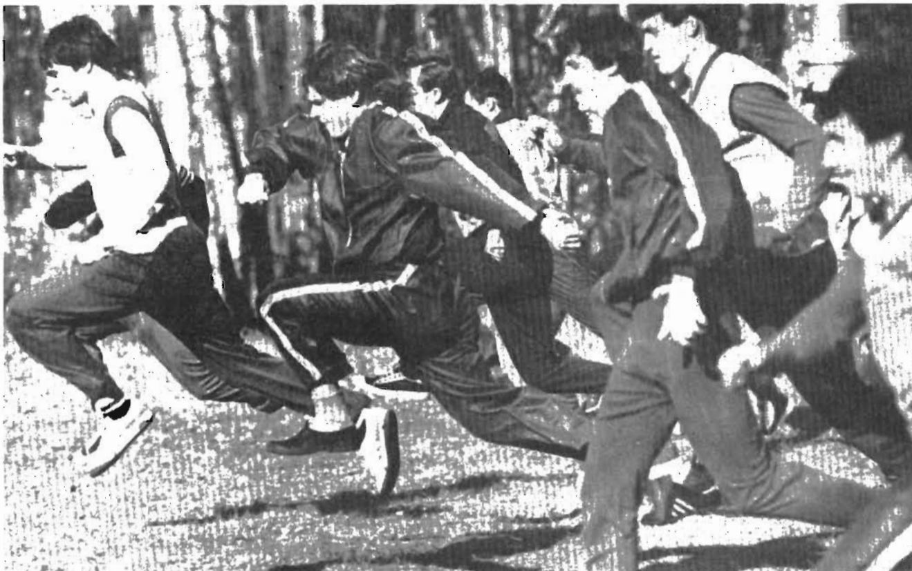
По осенней тропе.