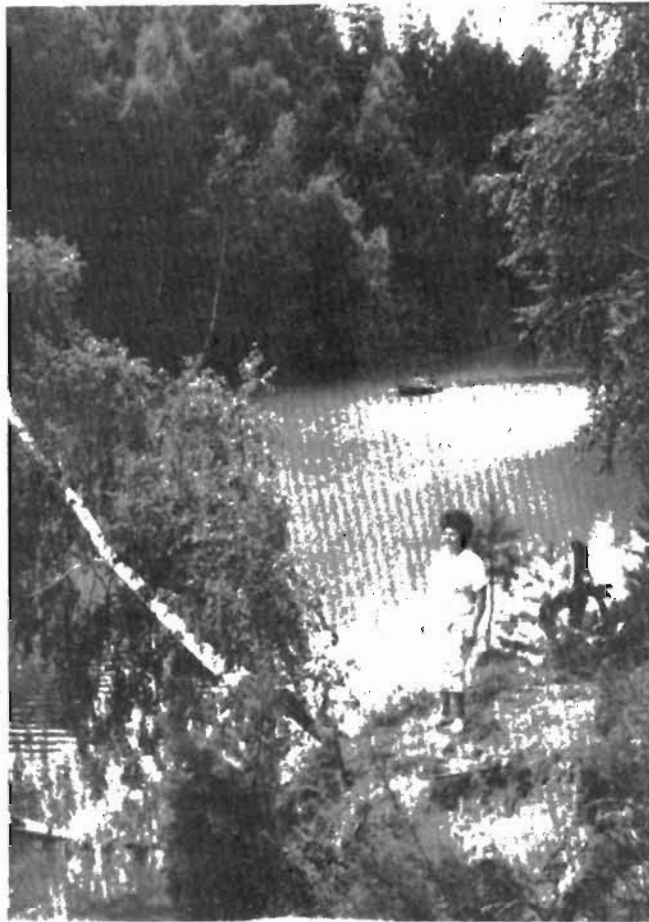
В Горной Шории.