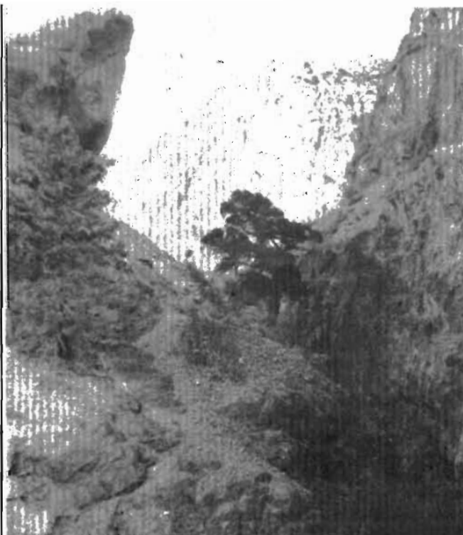
В горах одиноко...