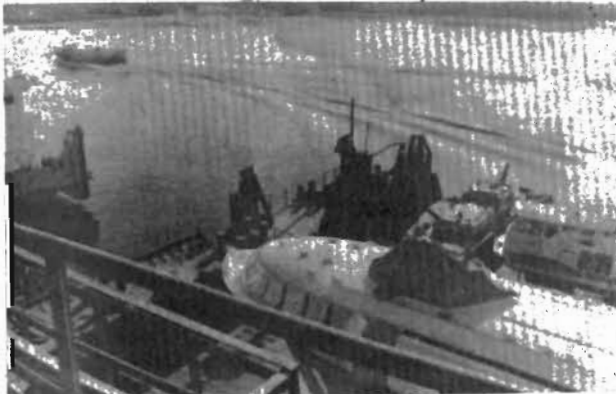
Якутск. На реке Лене завершается навигация. Она, вероятно, войдет в историю не только как юбилейная - Ленское пароходство отметит свое 100-летие, - но и как самая сложная.

Сокращение объемов перевозок по рекам бассейна, хронические неплатежи, работа в долг свели на нет работу Якутского речного порта. Более трети судов стоит на приколе. И лишь один вид грузоперевозок превзошел по объему навигацию 1993 года - перевозка контейнеров, уезжающих из Якутии навсегда золотодобытчиков, шахтеров, портюков. Более 2500 контейнеров с домашними вещами прошло через Якутский речной порт, и более 200 семей стоят в очереди за свободными контейнерами.