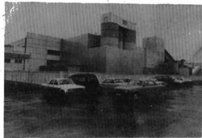
Бетон для частных домов

Новосибирск. Промышленный выпуск ячеистого бетона начат на российско-германском предприятии «Сибит».