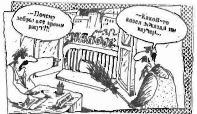
Рисунок В. ШИЛОВА.