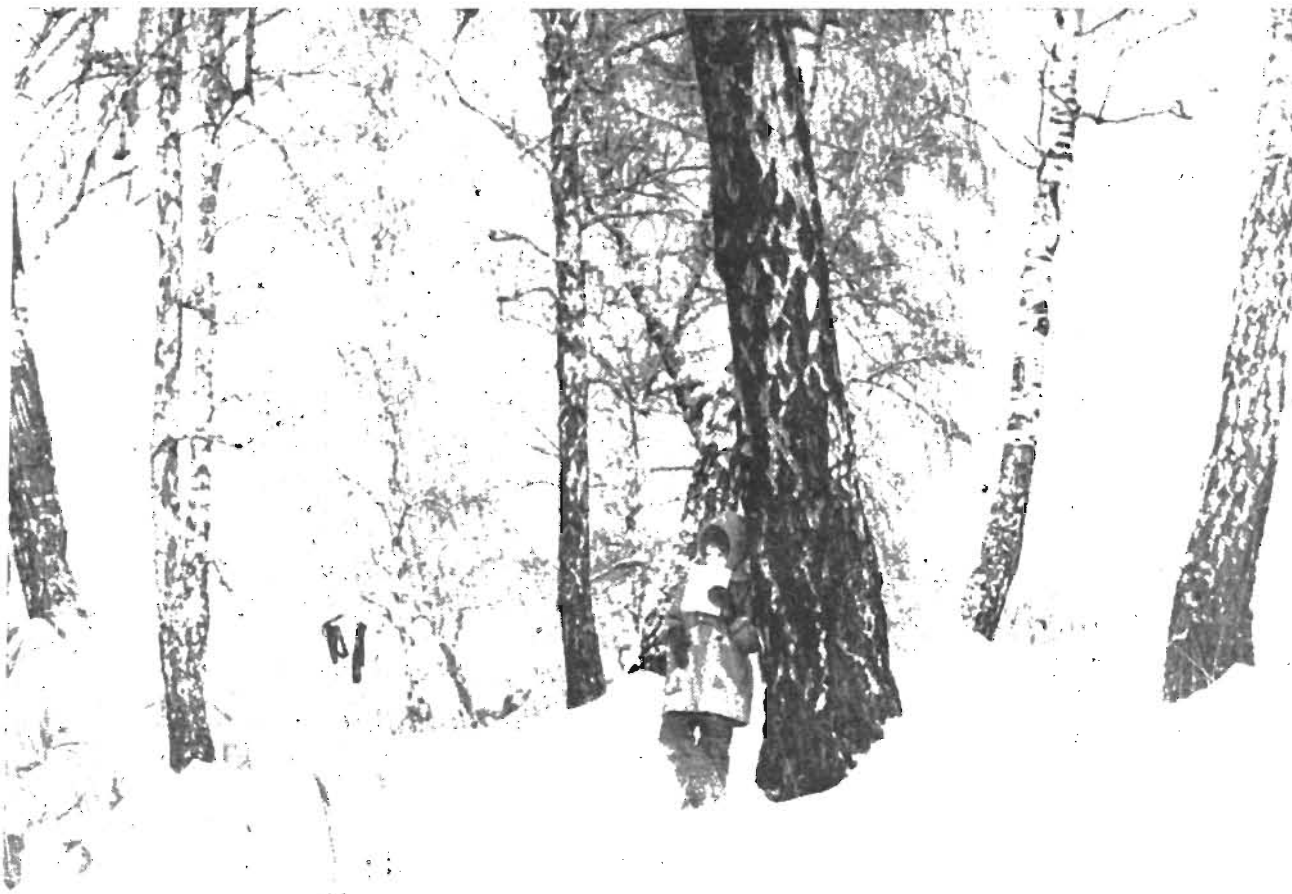
В зимнем парке