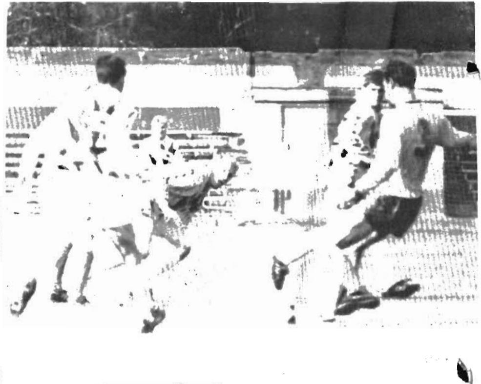
В атаке «Заря»