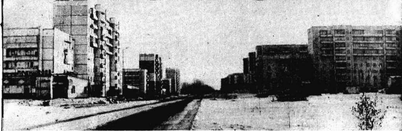
Специальный выпуск для жителей г. Полысаева