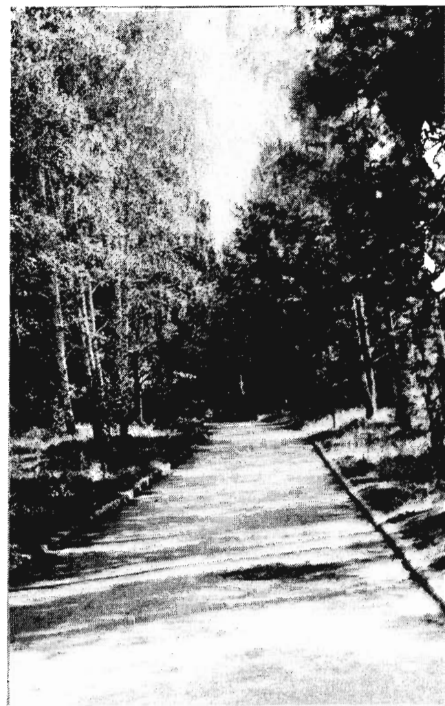
В тенистой аллее.