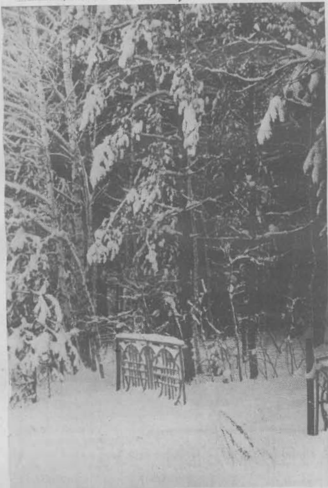
В зимнем парке.