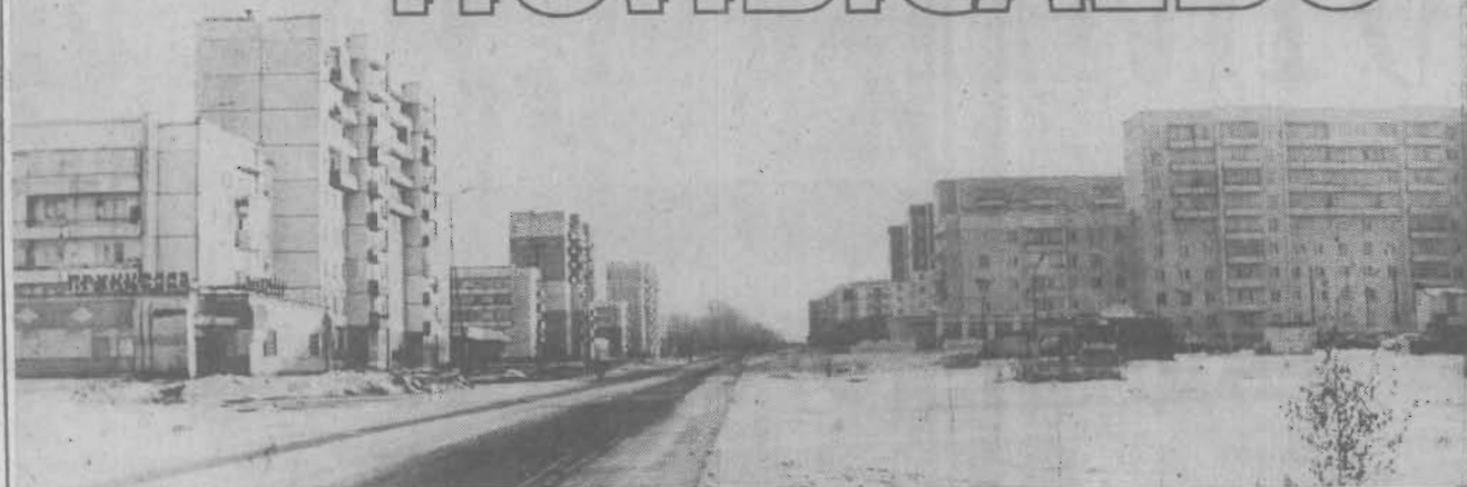
Специальный выпуск для жителей г. Полысаева