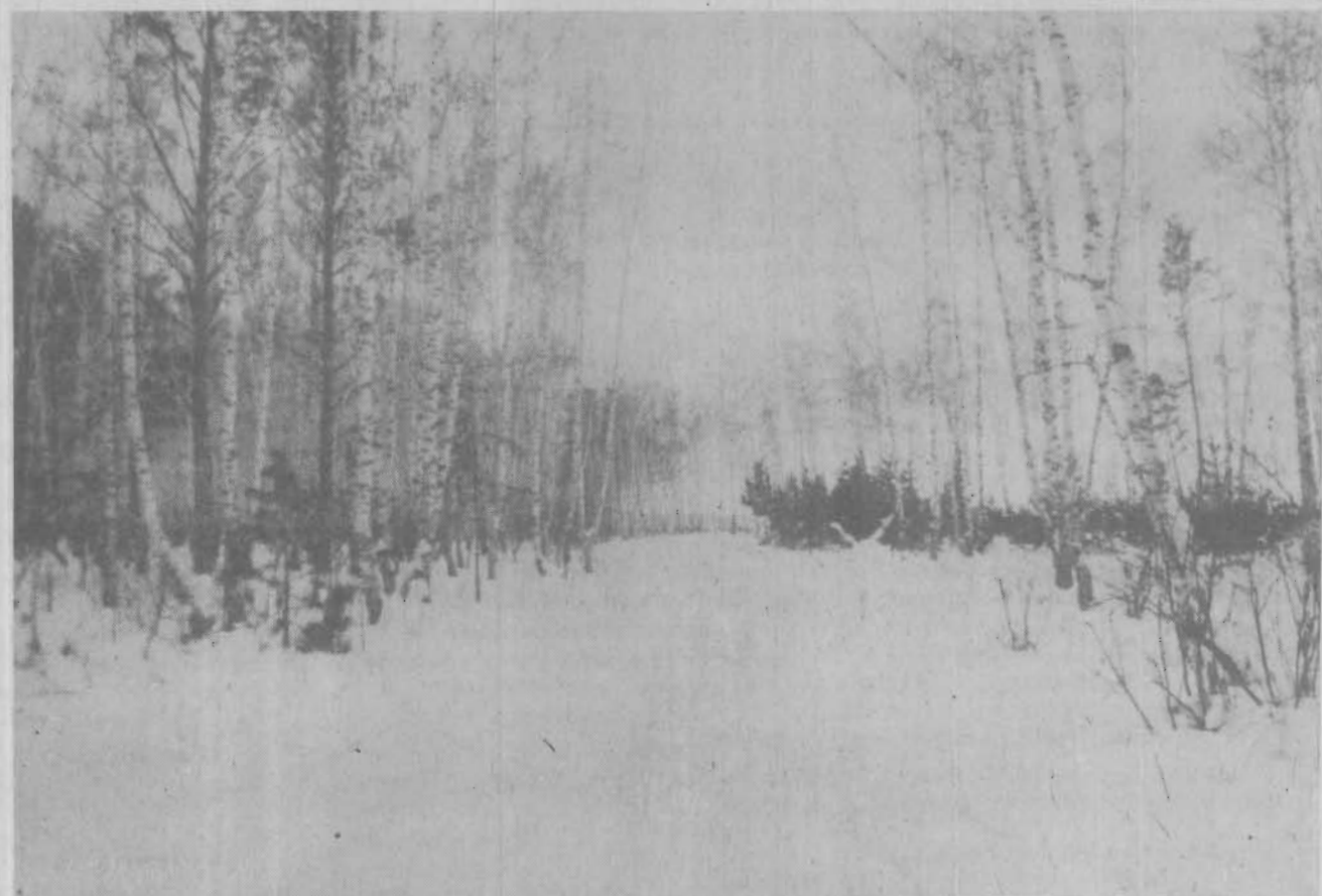
В лесной тиши.