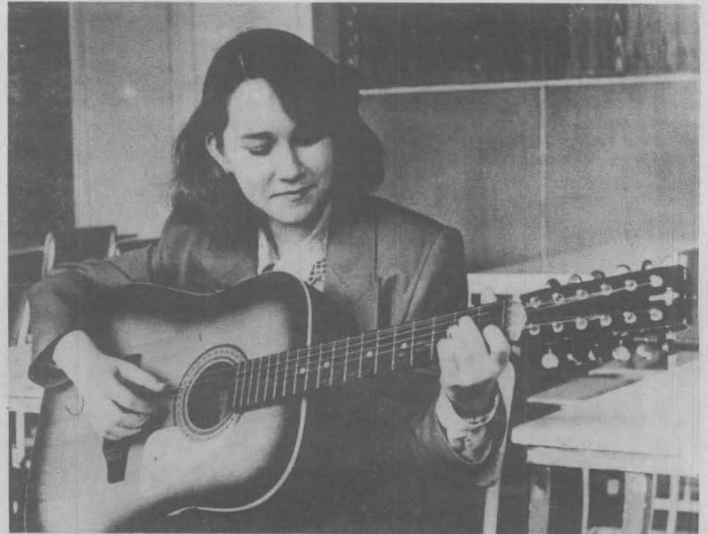
Я расскажу гитаре, как подружке...