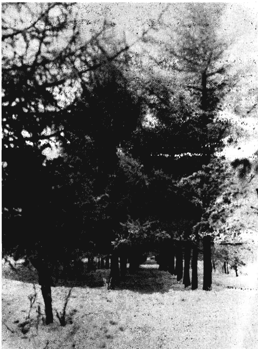
В белом кружеве деревья стоят...

Прием в Ленинске-Кузнецком 23-24 марта, запись по телефону 3-28-12.