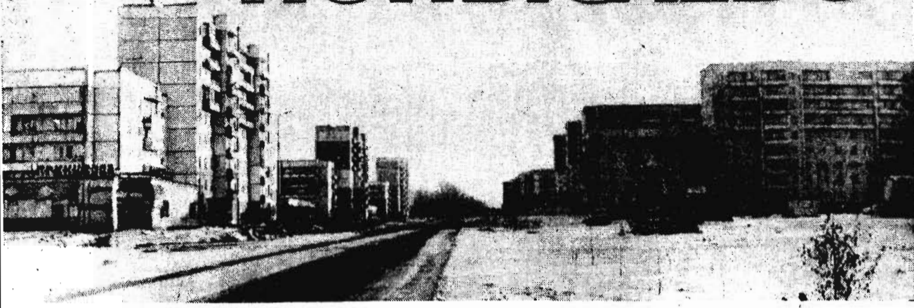
Специальный выпуск для жителей г. Полысаево