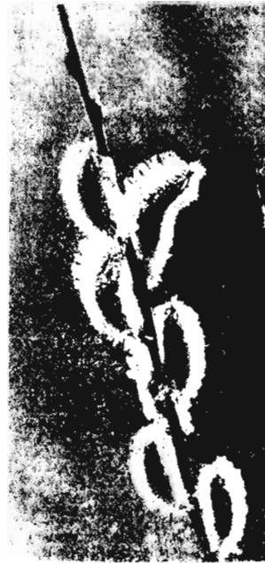
В лесу одну ее весна

Еще холодов не признает Хотя собою неприметна, И не стройна, и не красна, Но украшает первым цветом