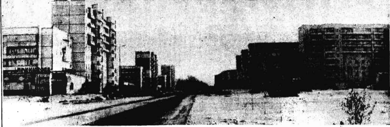
Специальный выпуск для жителей г. Полысаева