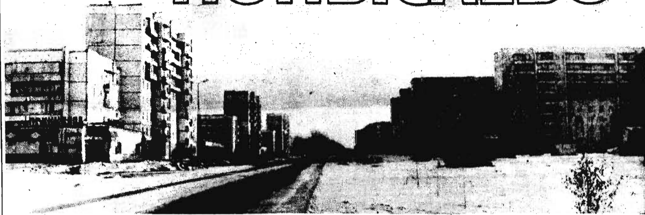
Специальный выпуск для жителей г. Полысаево

НЕСКОЛЬКО лет назад, когда началась приватизация, мы были уверены, что многое в нашей жизни изменится к лучшему, и в частности в сфере торговли. Это сейчас, говорили мы, продавец работает абы как, а вот когда он сам станет владельцем магазина, то сделает все, чтобы понравиться покупателям, чтобы в его магазин заходили почаще, покупали побольше. Ну, если уж не сам продавец захочет это сделать, то уж частный владелец заставит продавца культурно обслужить покупателя, не обсчитать, не обвесить его. Товарооборот, а значит, прибыль – вот что будет двигать такими людьми.