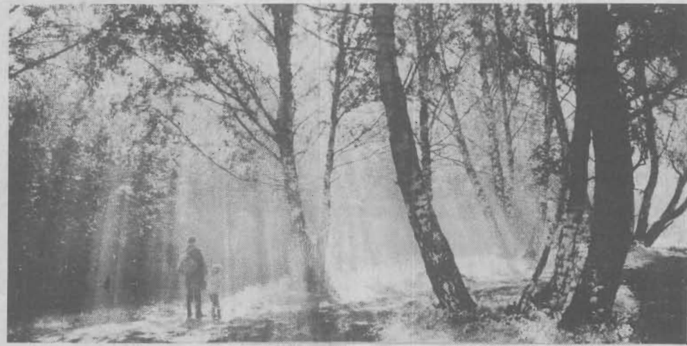
На лесной тропе.