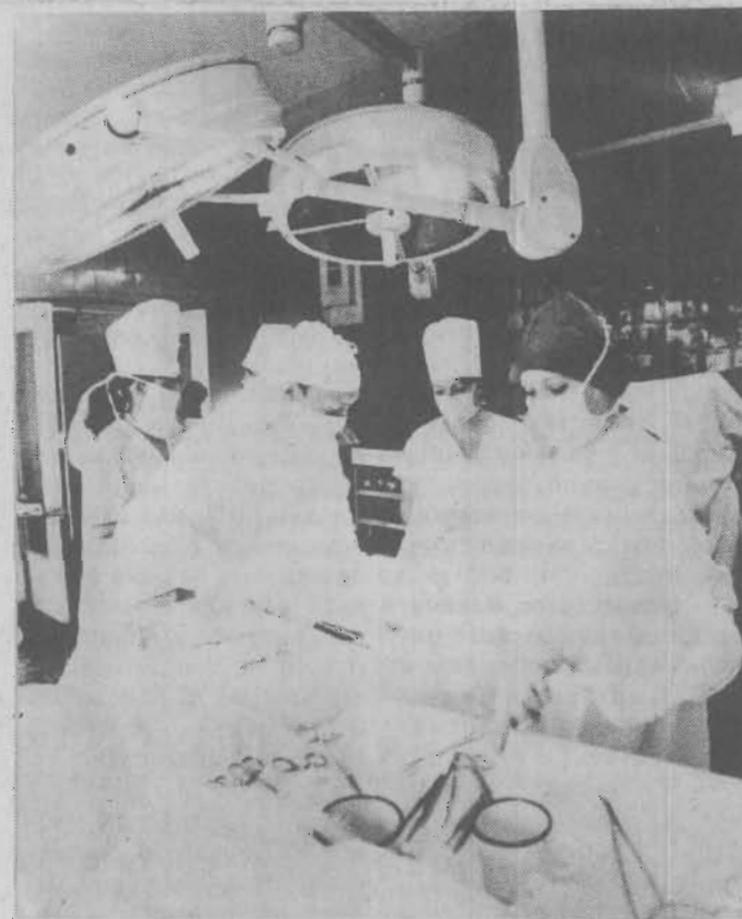
На снимке: идет очередная операция в первой горбольнице.

санитарке 200 тысяч дают или матери-одиночке с двумя детьми.