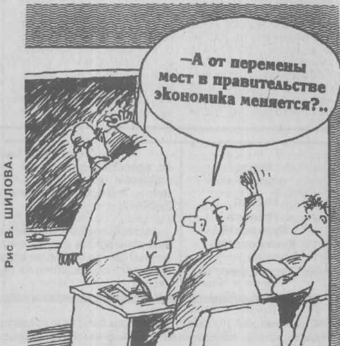
Рис В. ШИЛОВА.