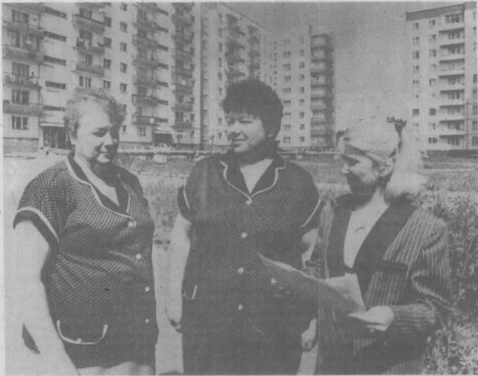
Завтра - День российской почты