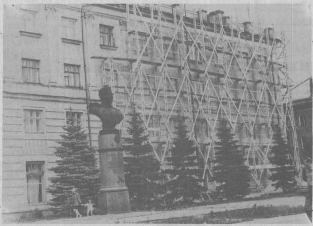
Оделся в леса еще один дом в центре города - по улице Ломоносова, 2. Строители фирмы «Сибсервис» уже знакомы с отделкой подобных фасадов: именно они реконструировали в прошлом году два здания здесь же. Планируется такое же водостойкое покрытие, оно хоть и дороже «шубы», но надежнее, в этом легко убедиться, взглянув на здания «Кузбассоцбанка» или «Гастронома». Цвета здания останутся прежние: песочно-желтые, что позволит в едином стиле выдержать площадь Победы. Помимо фирмы «Сибсервис», субподрядчиком работ выступает и трест жилищного хозяйства.

В О ВТОРОМ квартале текущего года приемной граждан зарегистрировано 560 обращений к главе администрации и его заместителям, что почти в два раза выше соответствующего периода 1996 года. Увеличилось число коллективных обращений. Больше всего горожан волнуют вопросы социального характера: несвоевременная выплата зарплаты, пенсий и пособий, предоставление льгот по федеральному закону «О ветеранах», обеспечение жильем, неудовлетворительное коммунальное обслуживание, трудоустройство. По всем обращениям, в том числе анонимным, были даны конкретные поручения. 82 процента обращений уже рассмотрено, в половине случаев оказано содействие в решении вопроса, а третья часть просьб удовлетворена.