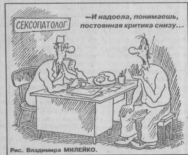
Рис. Владимира МИЛЕЙКО.