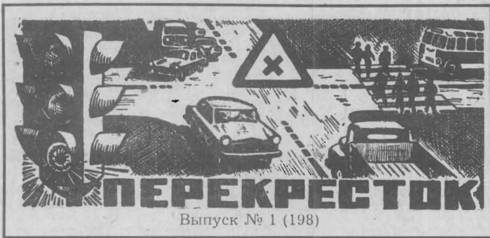
Выпуск № 1 (198)