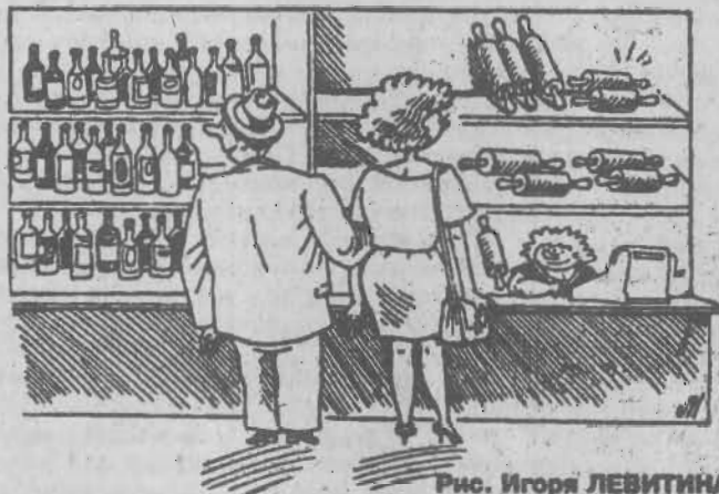
Рис. Игоря ЛЕВИТИНА.