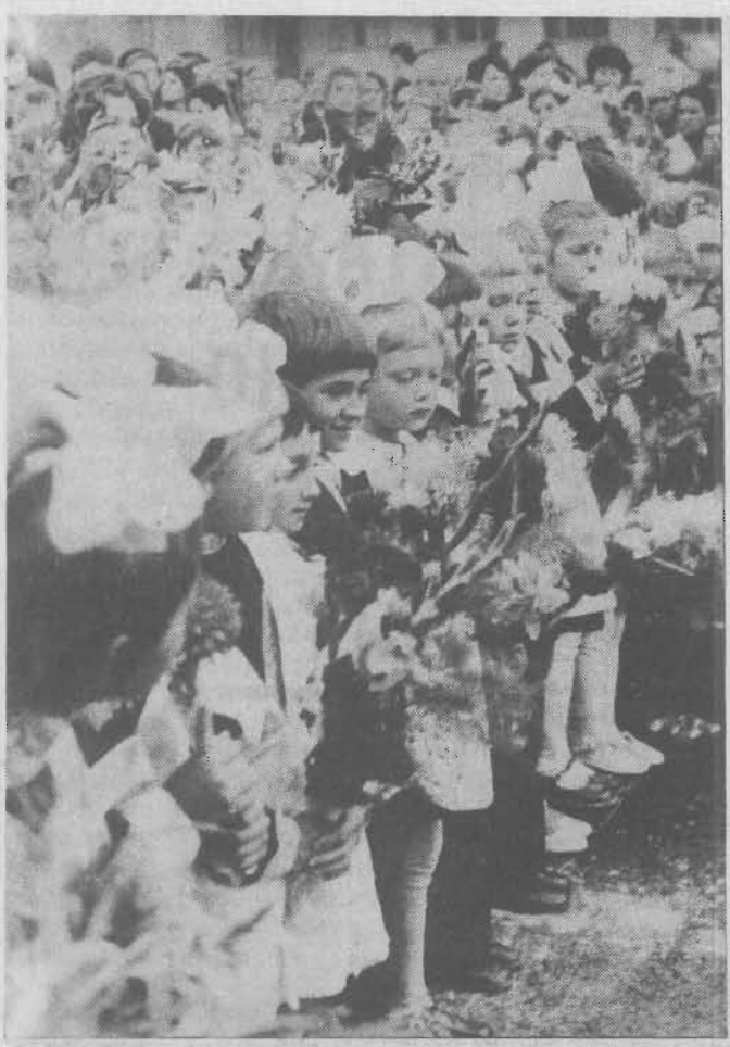
Первый раз в первый класс.