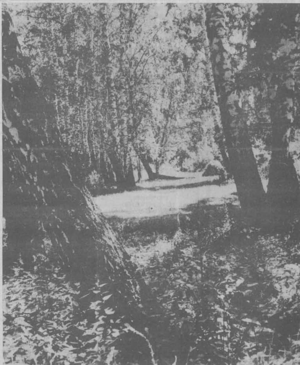
Есть в осени первоначальной короткая, но дивная пора...

Сниму двухкомнатную благоустроенную меблированную квартиру в центре. Телефон 2-41-57.