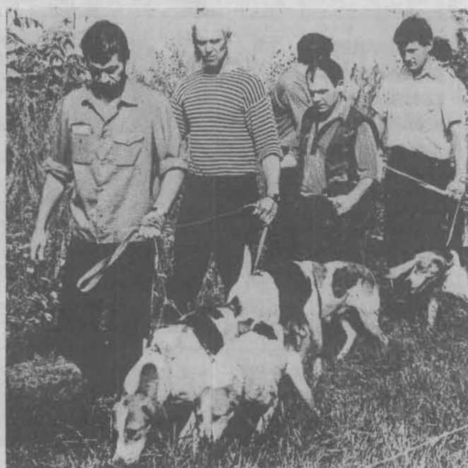
На выставку с питомцами.

Воймите помидоры и срежьте «крышечки», выскребите мякоть, посолите и поперчите изнутри. Сыр и ветчину нарежьте мелкими кубиками и смешайте с зеленым горошком. Майонез смешайте со сметаной и зеленью, добавьте сыр, ветчину и горошек, перемешайте. Помидоры наполните фаршем и прикройте «крышечкой». Подавать на листьях зеленого салата. Время приготовления - 15 минут.