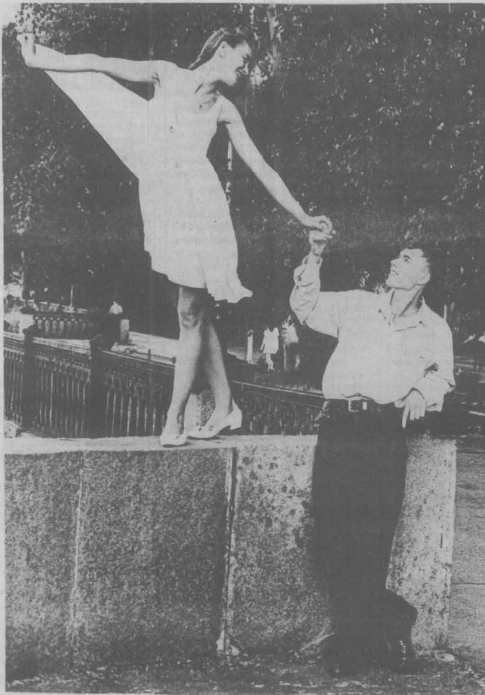
Нет руки надежнее.

Дыхание мая, осенней разлуки И летних последних ночей, Зачем обещала тебе я когда-то Тепло, горя свечой? Л. ШАНТАЕВА.