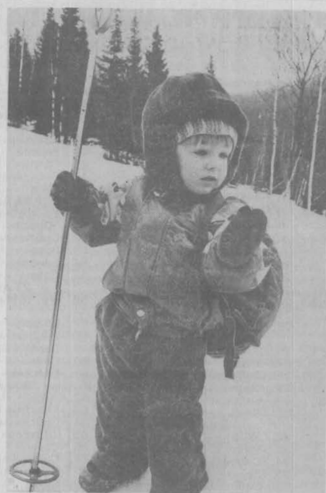
ПО ПЕРВОМУ СНЕЖКУ.