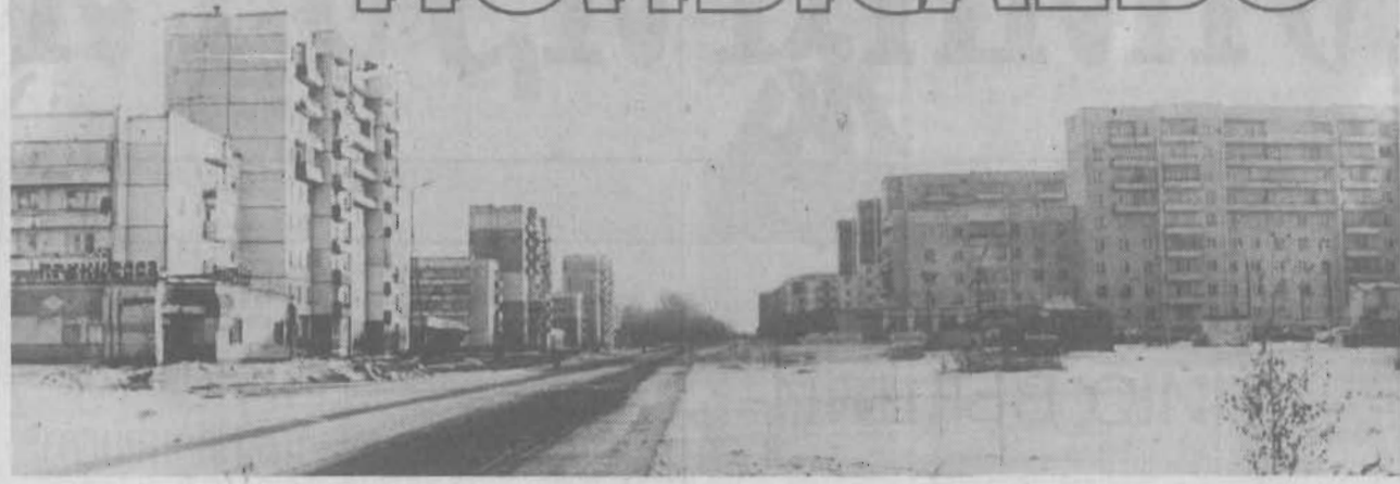
Специальный выпуск для жителей г. Полысаева