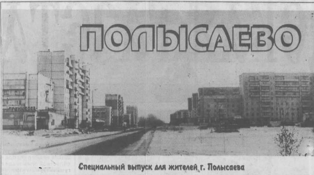
Специальный выпуск для жителей г. Полысаева