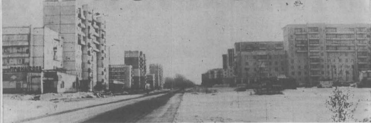
Специальный выпуск для жителей г. Полысаева