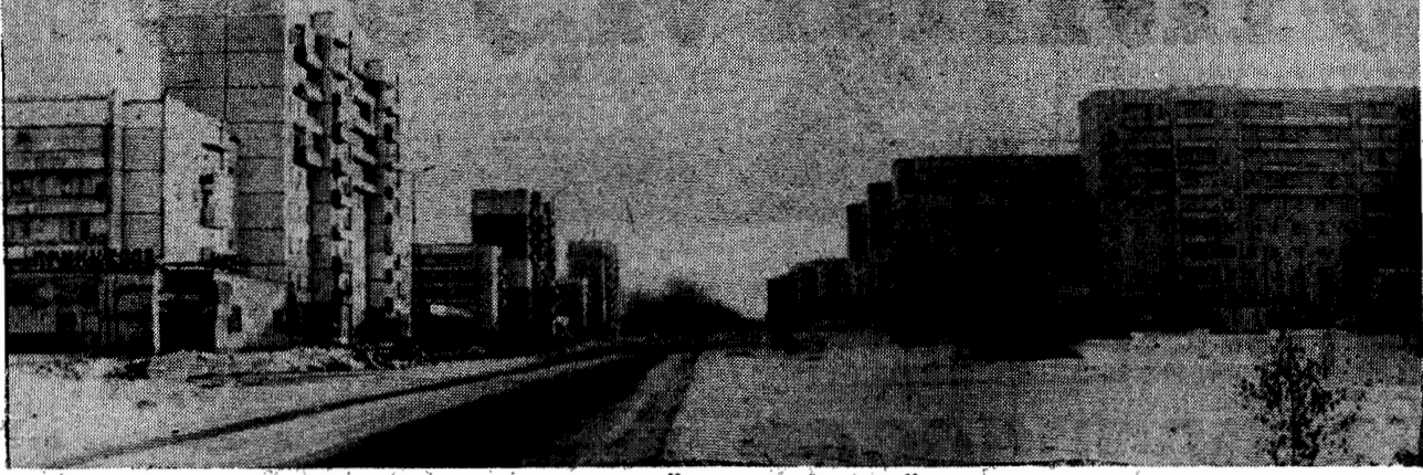
СТРАНИЦА ПОЛЫСАЕВСКОЙ ГОРОДСКОЙ АДМИНИСТРАЦИИ

НА ОЧЕРЕДНОМ заседании коллегии администрации города были рассмотрены вопросы работы финансово-экономической комиссии и о ходе исполнения принятых на ней решений. Заслушан отчет исполнительской дисциплины по письменным обращениям граждан, а также отчет отдела по учету и распределению жилья и перерегистрации граждан, нуждающихся в улучшении жилищных условий.