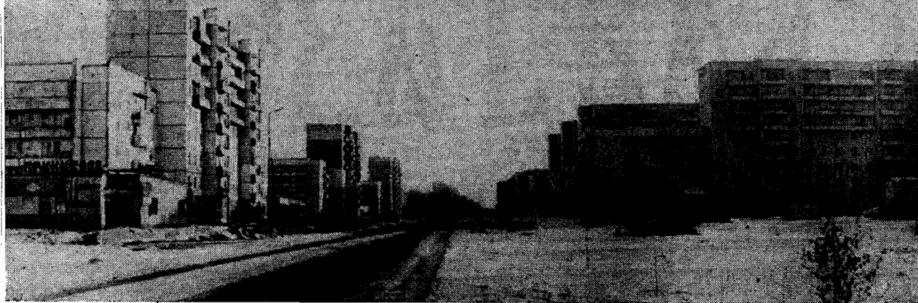
СТРАНИЦА ПОЛЫСАЕВСКОЙ ГОРОДСКОЙ АДМИНИСТРАЦИИ