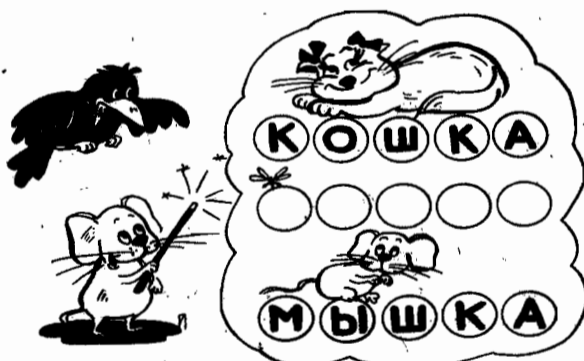
За два хода, изменяя по одной букве в слове, превратите «кошку» в «мышку».