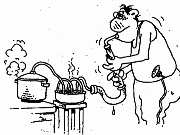
Рис. Игоря Кийко.

По горизонтали: 2. Реализм. 6. Бовари. 7. «Ивушка». 8. Терновник. 11. Топаз. 12. Орган. 14. «Таманго». 17. Манометр. 18. Кольчуга. 20. Пеликан. 21. «Остин». 23. Дойна. 27. Парамушир. 28. Коцебу. 29. Терцет. 30. Салазки. По вертикали: 1. Болеро. 2. Рифей. 3. Ледостав. 4. Мидия. 5. Оксана. 9. Хандошкин. 10. Прончатов. 11. Тремоло. 13. Наварра. 15. Антре. 16. «Гроза». 19. «Кикимора». 22. «Скупой». 24. Нансен. 25. Бахус. 26. Витти.