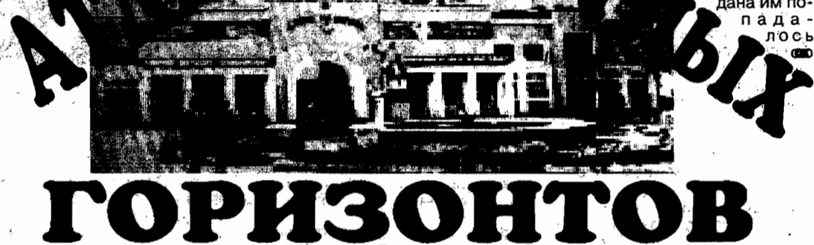
АТЛАНТЫ ШАХТНЫХ ГОРИЗОНТОВ