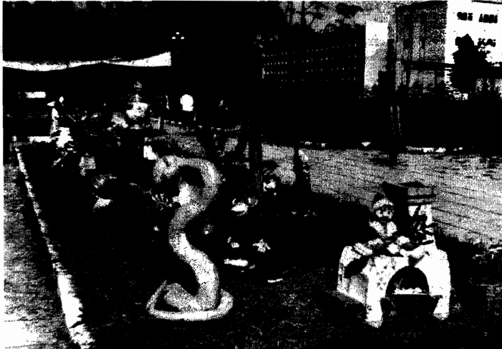
На площади у Дворца культуры имени Ярославского бывает многолюдно не только в выходные дни, но и в будни. Здесь постоянно организуются различные культурные мероприятия: конкурсы, соревнования, выставки.

На снимке: экспозиция выставки детского творчества.