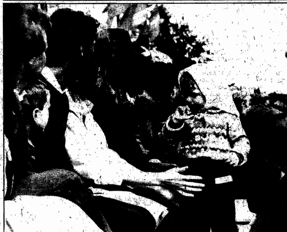
-А че это вы тут делаете, а?