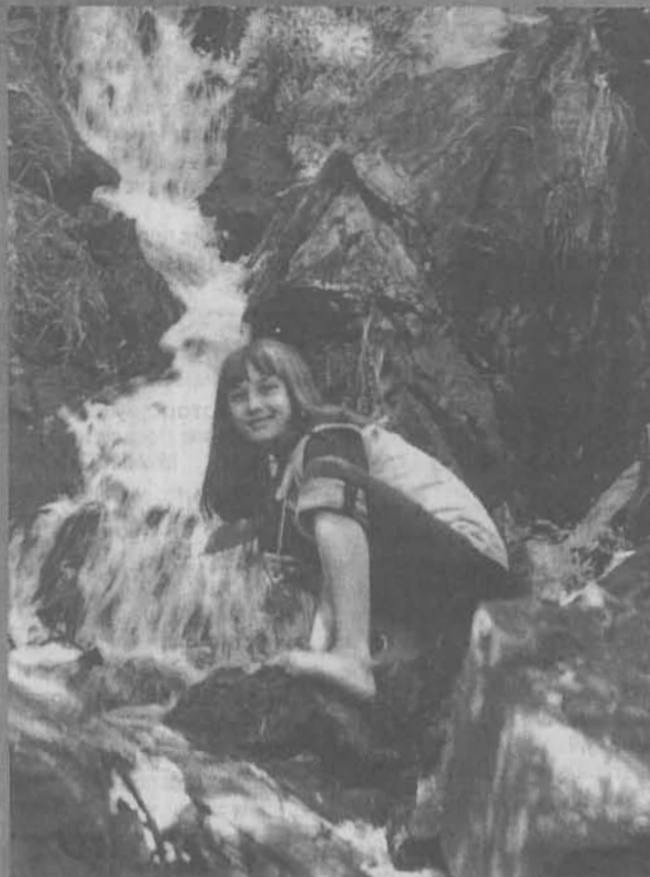
Лучше гор могут быть водопады...

Ведь вы боролись - мы же знаем, За жизнь боролись вы с судьбой, И без еды и без оружия, Остались в памяти людской.